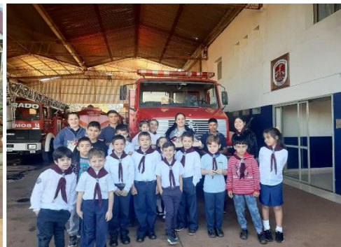
Visitas de diferentes escuelas al Cuartel Central.

Además, nuestra institución ha estado representada en diversos actos oficiales. Entre ellos, destacamos la participación del Cuerpo Activo y el Cuerpo Auxiliar en el acto de