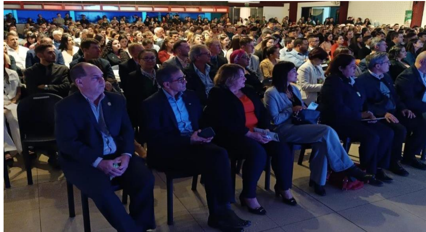
Acto de colación de la Facultad de Ciencias Forestales de la UNaM.