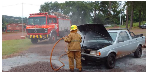
Intervención en incendios vehiculares.