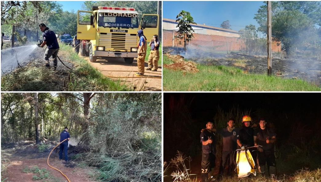
Intervención en diferentes incendios de vegetación.

A lo largo del año, el Cuerpo Activo de Bomberos Voluntarios de Eldorado ha intervenido en una amplia gama de servicios de emergencia, incluyendo incendios, rescates, accidentes vehiculares y la participación en eventos sociales. Es importante destacar que nuestras guardias operan las 24 horas del día, los 365 días del año, con personal siempre listo para atender cualquier solicitud de auxilio por parte de los ciudadanos.