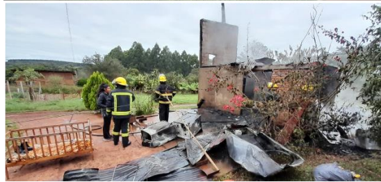
Intervención en incendios de estructuras.