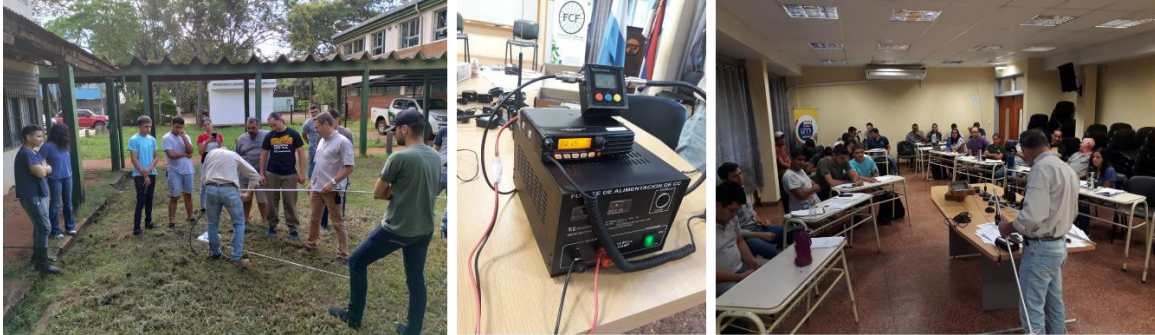
Taller de Radiocomunicaciones VHF y UHF (Handy y bases).