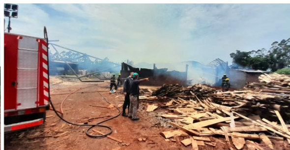
Incendios en el aserradero Asaguay, km 6, Eldorado.