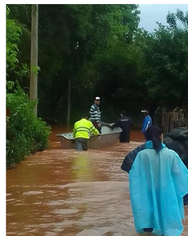
Operativo de rescate y seguridad durante la inundación en el barrio Roulet, Eldorado.

Entre los incendios más significativos, mencionamos el ocurrido el 24 de noviembre en el aserradero Asaguay del Km 6, donde movilizamos varios equipos y personal para controlar el fuego de manera efectiva. En este caso el servicio fue de casi 24 horas.