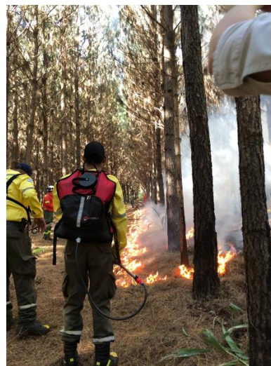
Capacitación en el marco de la DIMAIEF.