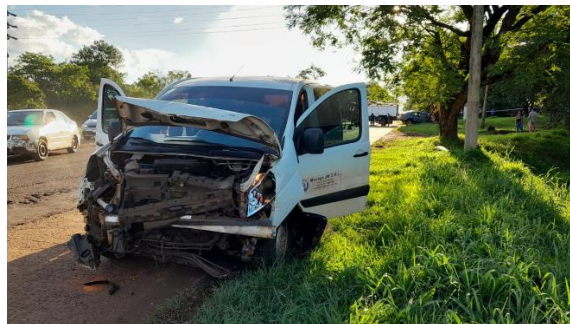
Intervención en accidentes vehiculares.