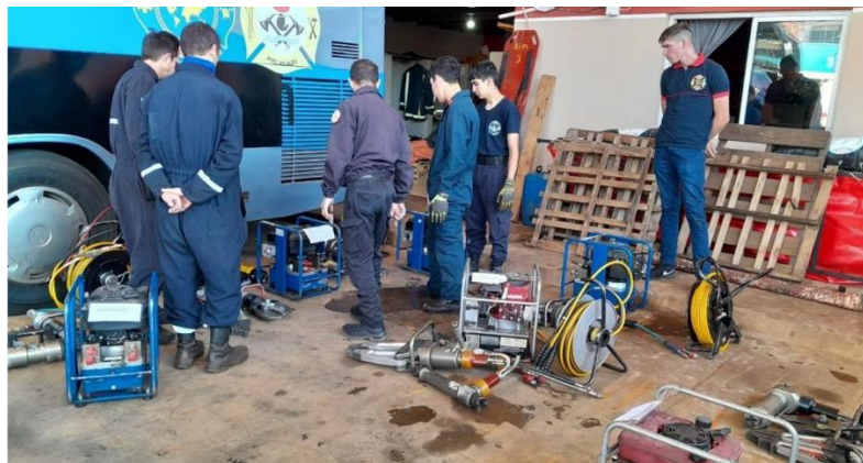
Adquisición de equipos para rescate vehicular.